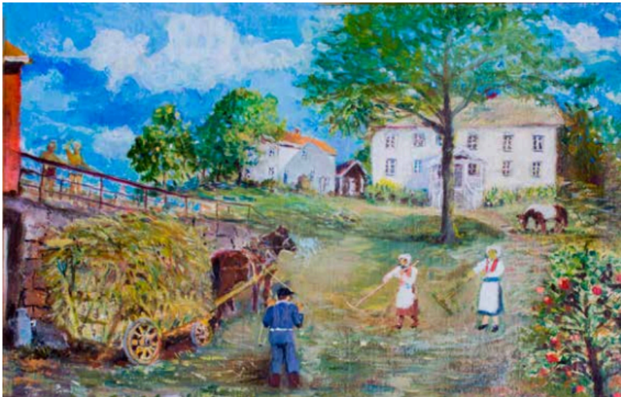
Maleri av: Billedkunstner Rolf Jørgensen