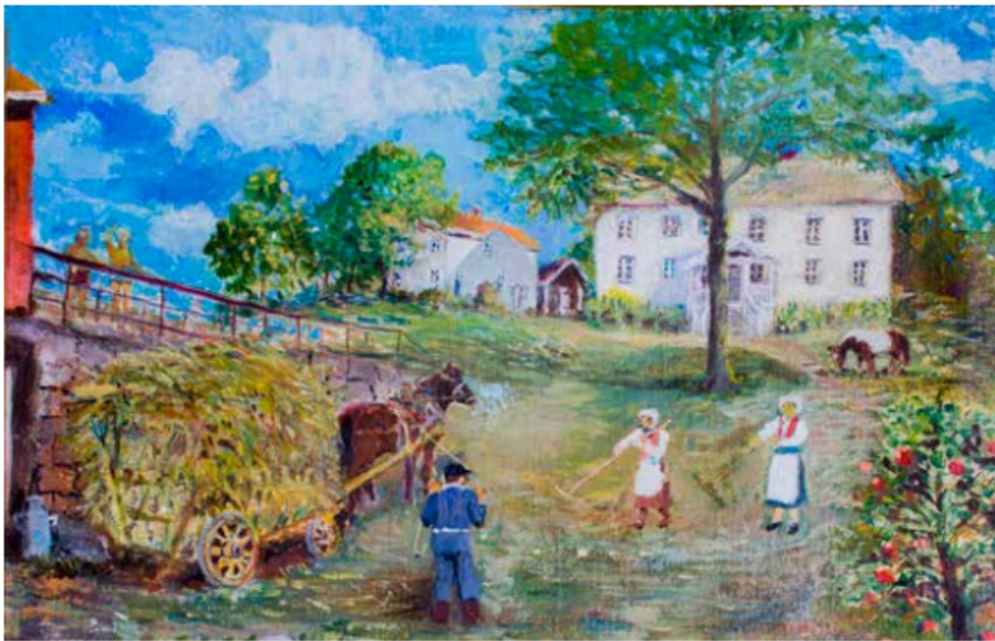
Maleri av: Billedkunstner Rolf Jørgensen

Onsdag 24. januar 2024 kl 19:00 Menighetssalen i Lambertseter kirke, Langbølgen 33