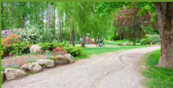
Dette ønsker Nordstrand MDG

Eiendoms- og byfornyelsesetaten foreslår i en ny reguleringsplan for Holtet at det skal