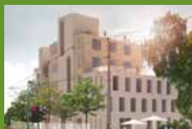
Dette ønsker EBY

sjon med en liten dam og benker, lekeområder, treningsapparater og kunstinstallasjoner som tilrettelegger for aktivitet.